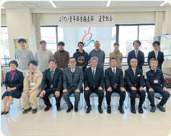
当日ご出席の皆さん