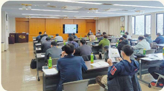
スマート農業情報交換会の様子