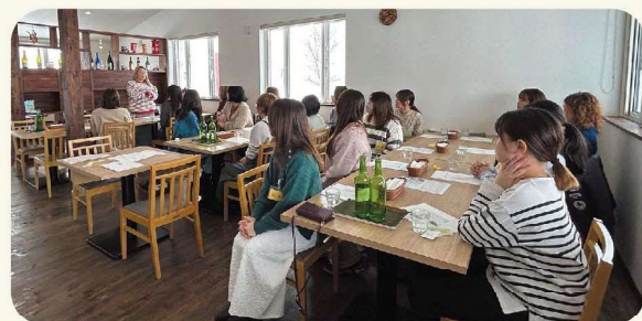
JAようてい女性部フレッシュミズ真狩支部・留寿都支部の皆さん