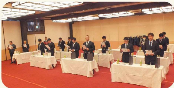
設立50周年記念式典の様子