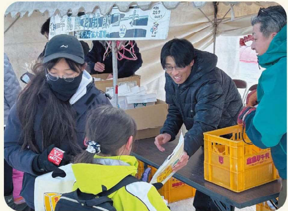
牛乳を配布しました!