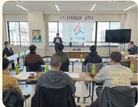
令和7年度の活動に向けて協議しました！