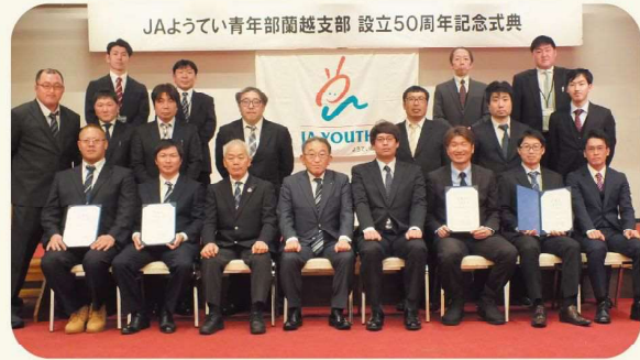
JAようてい青年部蘭越支部 設立50周年記念式典

式典後には祝賀会が開催され、今後の青年部活動について意見交換が行われるなど、盛会のうちに終了しました。 【担当：北野】