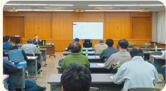
スマート農業機械等を紹介して頂きました！