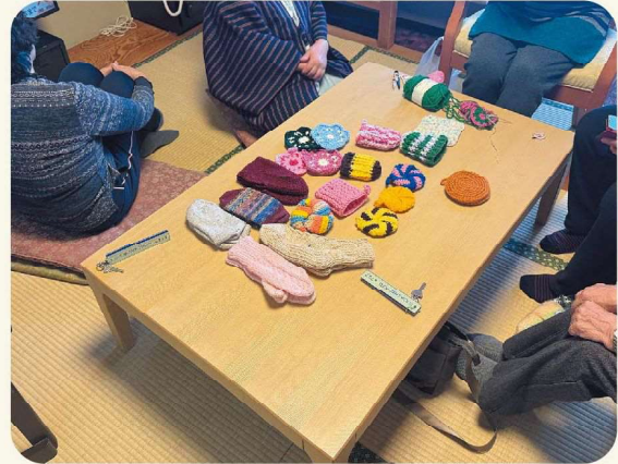
楽しい冬季研修となりました！