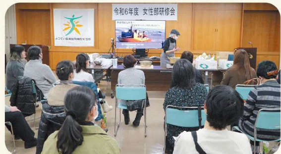
レシピ紹介の様子