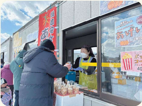
楽しく販売しました!

また、牛乳無料試飲では、牛乳パック370本と記念品を無料で配布するなど、大盛況のうちに終了しました。 【担当：福田（達）】