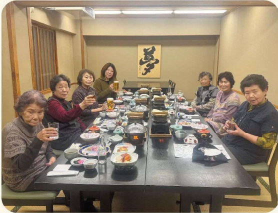
JAようてい女性部留寿都支部ダイヤモンド会の皆さん