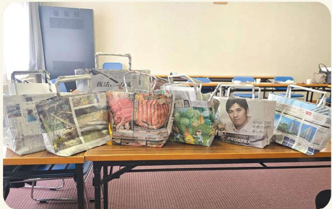
とてもきれいに完成しました!