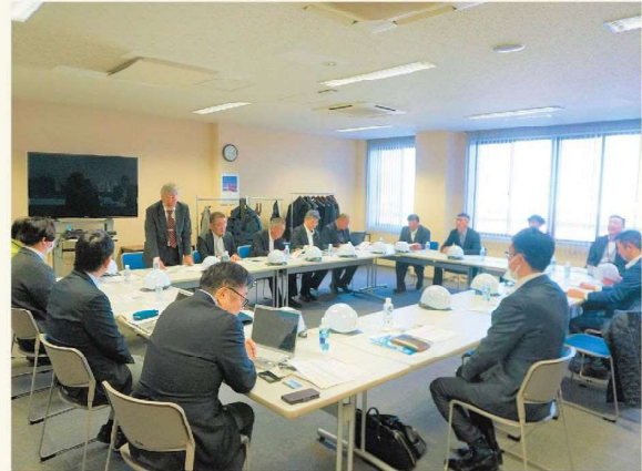
中継輸送など今後に役立つ内容を学びました!