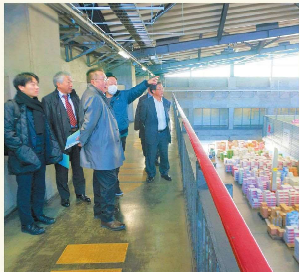
作物の品質確認を行いました！