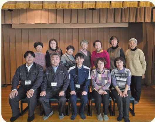
JAようてい女性部喜茂別支部と職員の方々