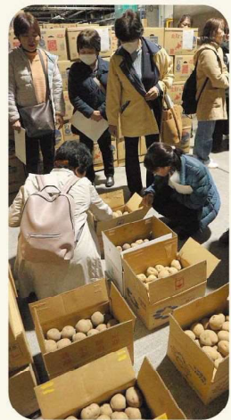
セントライ青果(株)