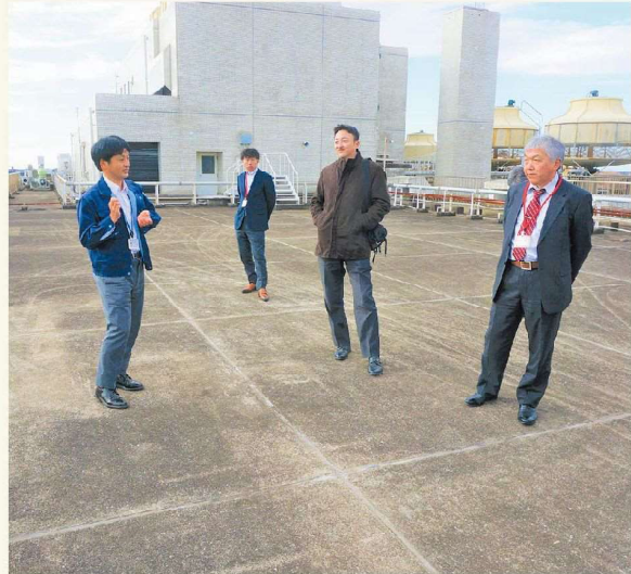
観測レーダーを見学しました！