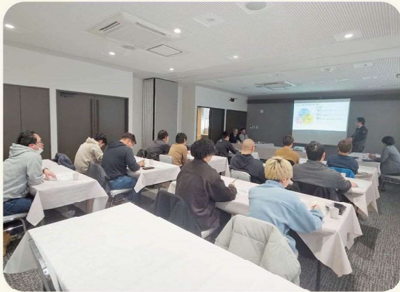
肥料講習会の様子（サンエー商事）