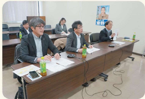
研修会の様子（本所）