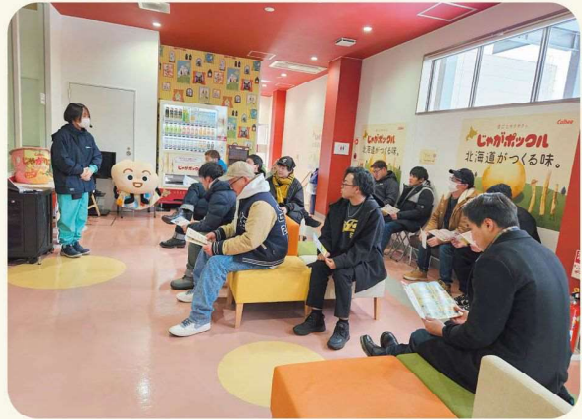
工場見学の様子（カルビー北海道工場）