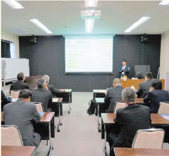
気象研究所について説明を受けました！

気象研究所は、昭和17年1月に設置された中央气象台研究科を前身に持ち、気象・地象・水象に関する現象の解明及び予測の研究や関連技術の開発に取り組み、気象業務技術基盤の高度化に貢献している気象庁の機関です。