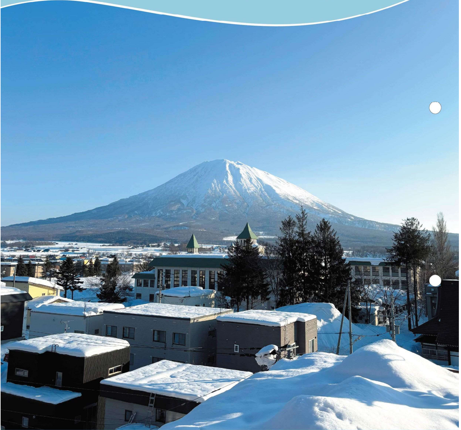
快晴の羊蹄山（倶知安町）