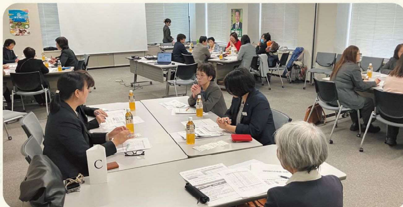
活発な意見交換が行われました!