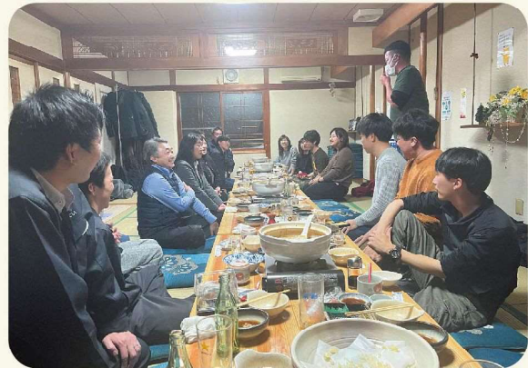
交流を深めることができました！