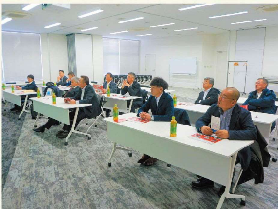
最新技術について説明を受けました!

センター内での整備状況や展示されている最新農業機械、最新技術に対する質問がなされるなど活発な意見交換が行われました。