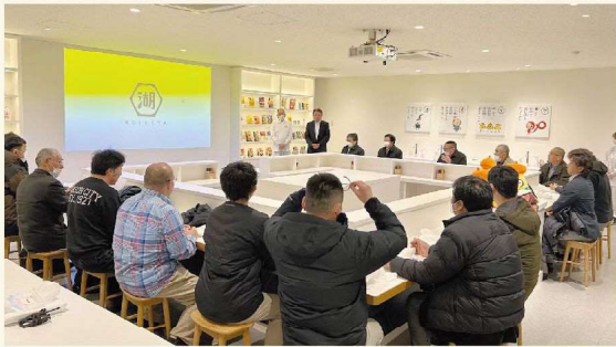
湖池屋九州阿蘇工場