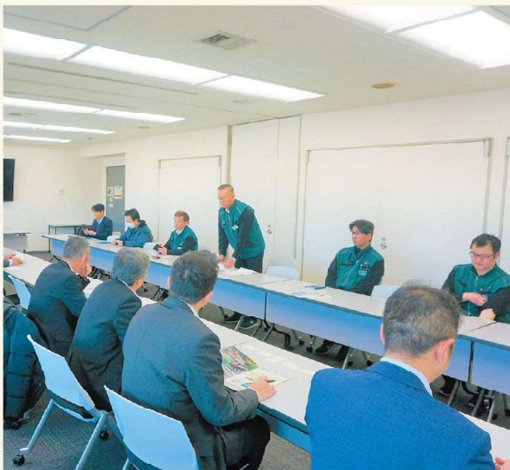
当産地以外の状況について説明を受けました！

委員からは、これからの馬鈴薯の品種構成や青果物についての要望が出されるなど活発な意見交換がなされました。