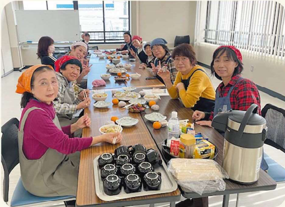
JAようてい女性部京極支部の皆さん