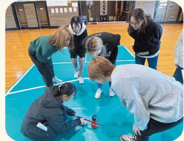
試行錯誤してプレーしました!