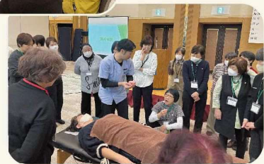
菅原整骨院 施術体験の様子