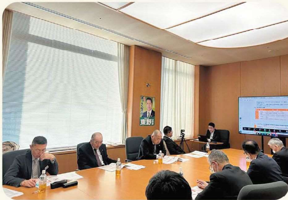
研修会の様子（札幌会場）