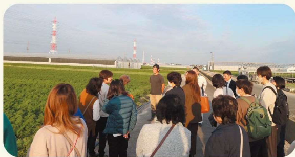
碧南にんじん圃場視察の様子