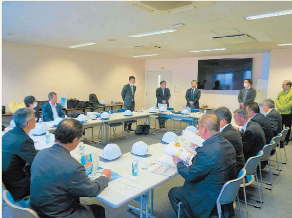
株式会社ファーマインド 青海センターの皆様ありがとうございました!

また、センター内の視察も行い、委員からは今後中継輸送を検討している品目等について担当者への積極的な質疑応答が行われました。