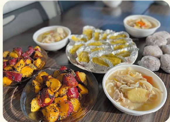
美味しく出来ました!