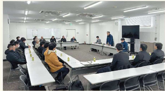
販売協議会の様子