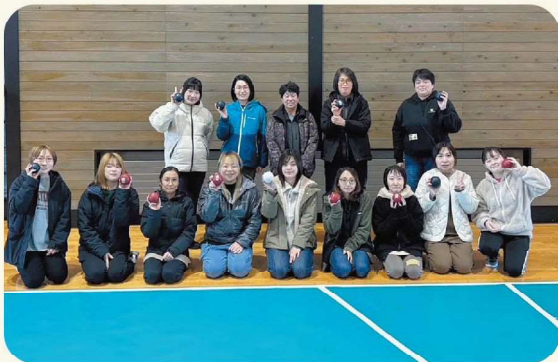
後志地区JA女性部フレッシュミズの皆さん