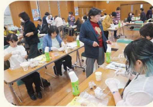
JA尾張中央女性部との交流会

2日目はJA尾張中央の女性部員との交流会を行いました。女性部員による活動報告を受けたほか、味噌玉づくり体験を通じて交流を深め、部員活動の課題などについて話し合いました。また、当JAと取引のある岩田食品(株)では、総菜の工場見学をしました。主力商品であるポテトサラダの半分は、ようてい産の馬鈴薯が使