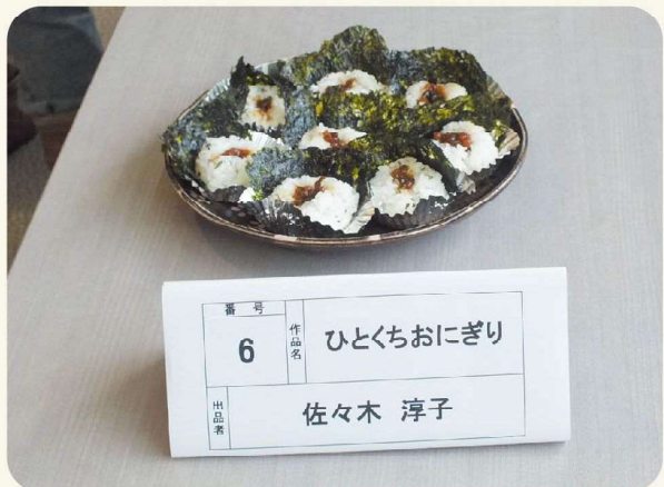
ひとくちおにぎり