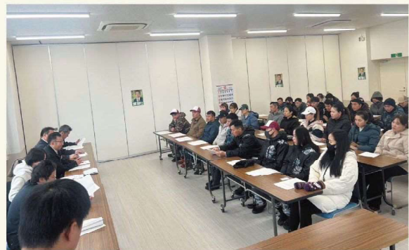
安全大会の様子（京極支所）