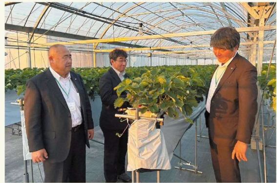
視察の様子（いちごハウス）