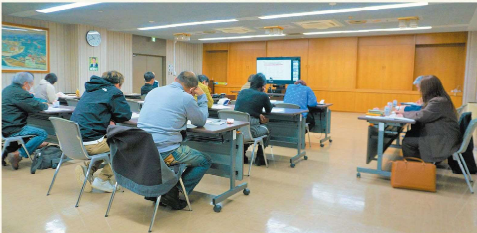
研修会の様子（本所）