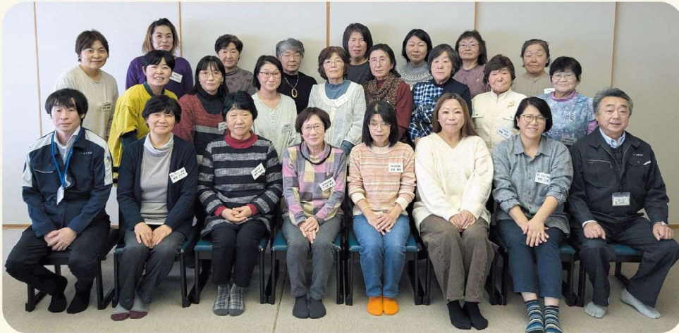
JAようてい女性部第3ブロックの皆さん