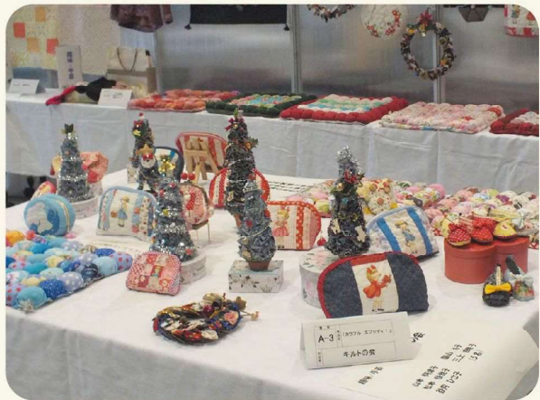
カラフル エブリディ！