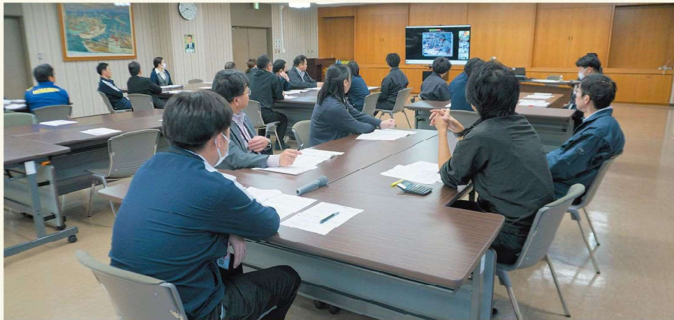
研修会の様子(本所)