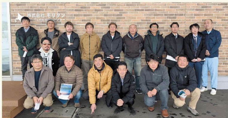
倶知安町畑作・野菜生産組合の皆さん