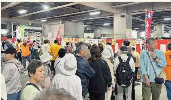
北足立市場まつりの様子