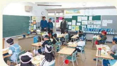
蘭越小学校2年生の教室の様子