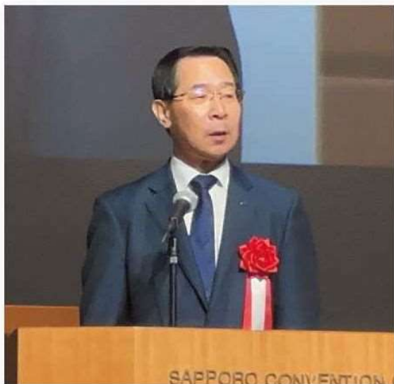
小椋副会長 閉会挨拶