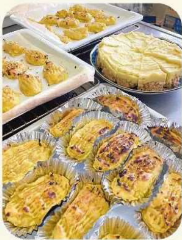
たくさんのお料理を披露しました!