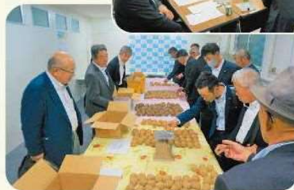
販売協議会の様子