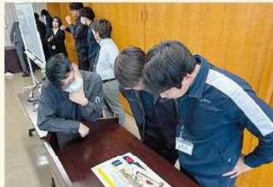
コミュニケーション研修の様子