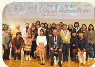
後志地区女性部の皆さん