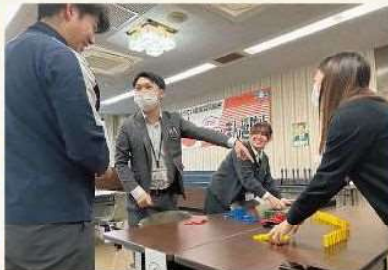
チームで協力しました!