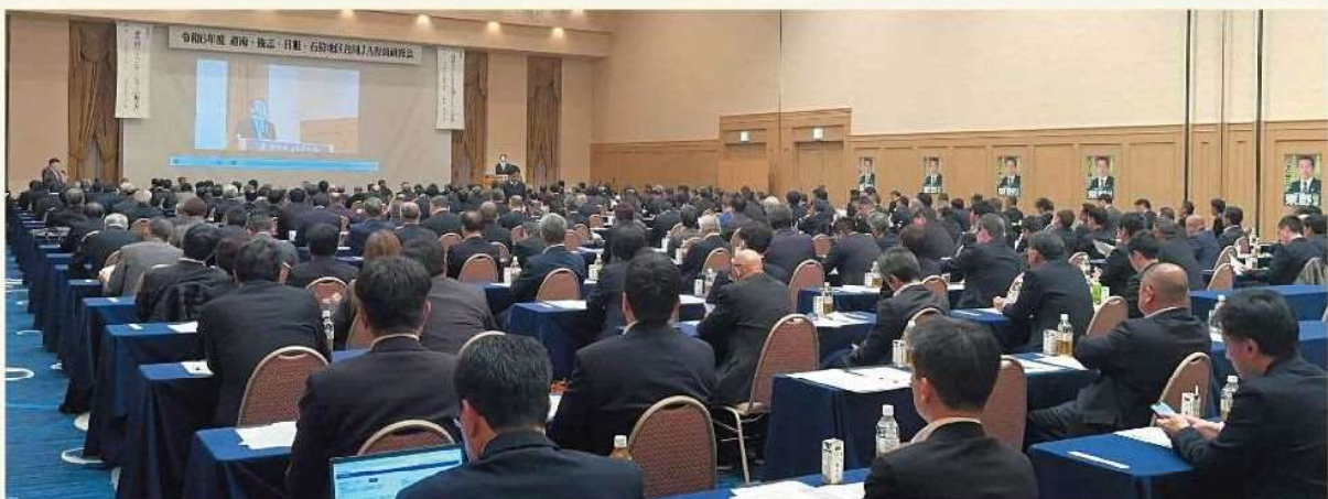
研修会の様子（国際館パミール）