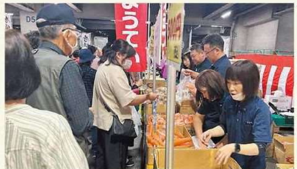
多くのお客様にお買い求め頂きました!