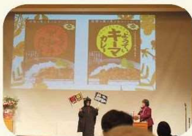
ようてい和牛・キーマカレーをPRしました