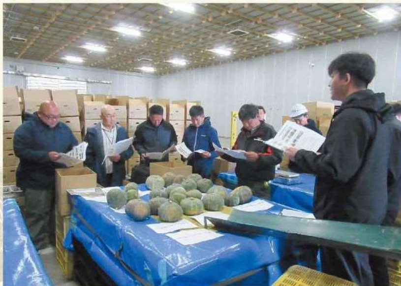
共選南瓜の目合わせの様子