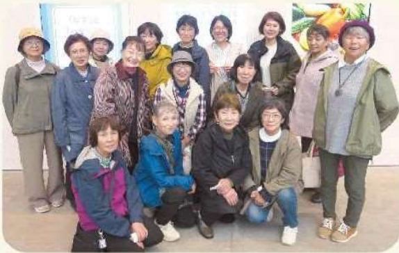
JAようてい女性部蘭越支部の皆さん