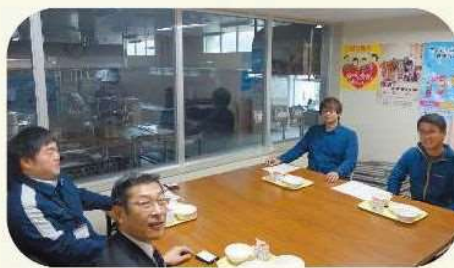
蘭越給食センターの様子