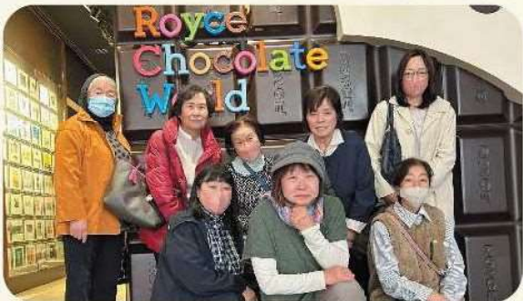
JAようてい女性部ニセコ支部の皆さん