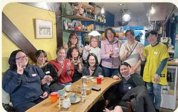
JAようてい女性部フレッシュミズ 第3ブロックの皆さん