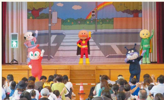
JA共済アンパンマン交通安全キャラバンの様子 ©やなせたかし/フレーベル館・TMS・NTM