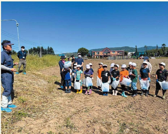
しっかりお話を聞いてくれました!