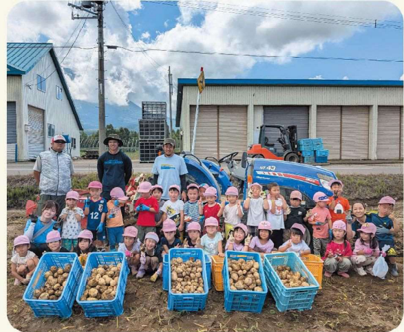
倶知安幼稚園年中クラスの皆さん