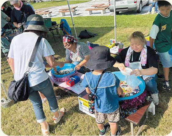
お菓子すくいは子供たちに大人気!

当日は好天に恵まれ、たくさんのお客さんが立ち寄ってくれました。【担当:松田(智)】