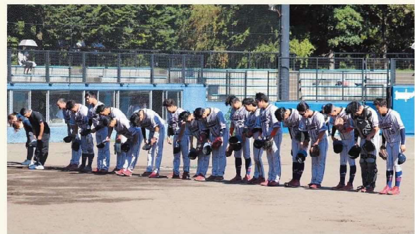
応援ありがとうございました！